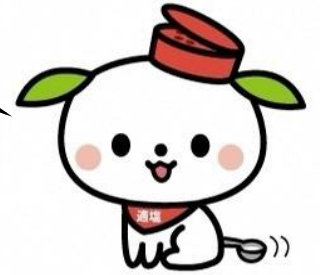
島田市 「ヘルしろう」