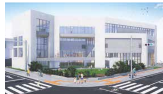
③ 外観：芝生広場がまちとこども館をつなぎ、誰もが気軽に立ち寄り集える施設を目指します。