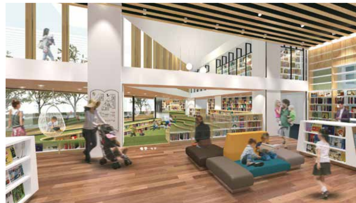
① 1階：靴を脱いでくつろぎながら親子で読み聞かせを楽しんだり、小さな空間で一人でこもって絵本を読んだり、それぞれのスタイルで読書を楽しめます。

子どもと子ども心を失わない大人のための新しい図書館です。「えほん」と創造、「えほん」と出会い、「えほん」と安心」をコンセプトに、絵本を通じた多様な体験を生み出します。絵とことばで楽しむ、絵本の世界を存分にお楽しみください！