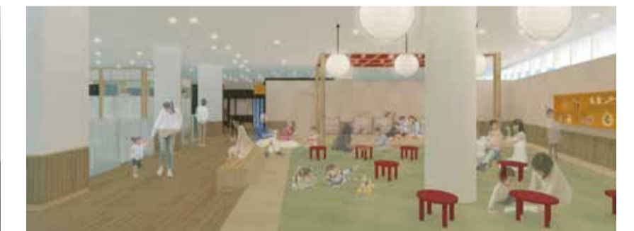
⑧ 3階 ざしきひろば：わらべうた、かるた、お手玉など日本の伝承遊びと積み木遊びを、広々とした量の上で楽しめます。