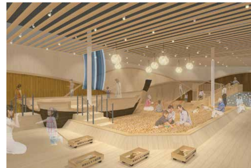
④ 2階 木のおおなばら：八丁櫓をモチーフにした船の遊具が漂う、全国最大級の木のたまごボールがお出迎え。

子どもから大人まで幅広い世代が楽しめるおもちゃと遊びの体験型美術館です。「人間が初めて出会うアートはおもちゃである」という理念の下、県産材を活用した空間とおもちゃを活かして、多くのお客様をお迎えし、誰もが笑顔で過ごせる時間を演出することを目指します！