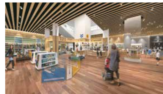
② 2階：飲み物を飲みながら、大人も子どももソファでゆったり読書を楽しめます。