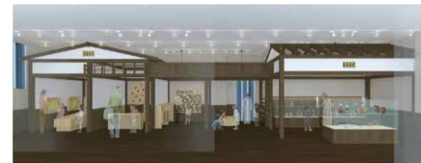
⑦ 3階 おもちゃ横丁：緑のようにさまざまな遊びの小屋が並んでいます。茶摘みやみかん狩りなど収穫遊びも楽しめます。