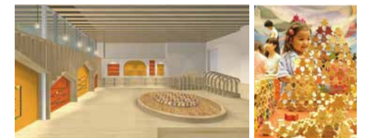
⑤ 2階 赤ちゃんひろば：木のぬくもり溢れる赤ちゃん専用の部屋。県産材のフローリングでハイハイしたりトンネルをくぐったり、五感を使って楽しめます。