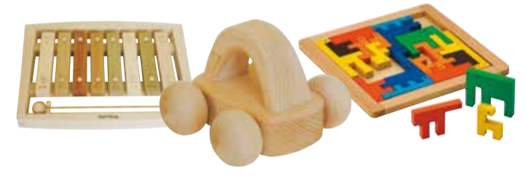
⑥ 3階 グッド・トイギャラリー：国産材の木のおもちゃや世界のロングセラーおもちゃなど、おもちゃの専門家によって選ばれた優良玩具が盛りだくさん！