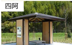
四阿 防災パーゴラ