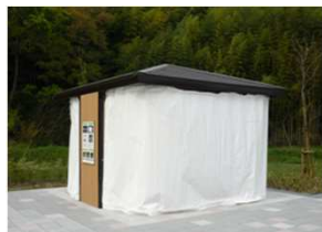
テント設営イメージ