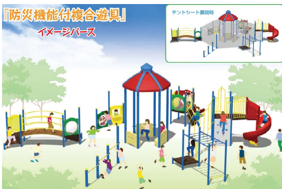
【防災機能付複合遊具】