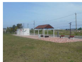
写真① 大井川中学校側から撮影

この広場は、地震、津波などの自然災害に備え、発災時の避難場所として、復旧復興時の応急仮設住宅の建設地として、また平常時には、地域の憩いの場として、イベント開催など多目的に利用できるスペースとして整備を進めてまいりました。 平成24年度より事業が始まり、事業用地をご提供いただきました地権者様や、基本計画策定などのワークショップにご参加いただいたくなど、ご支援・ご協力いただきました多くの地元関係者のおかげで、芝生広場の完成をすることができました。