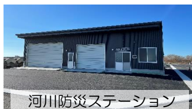
河川防災ステーション