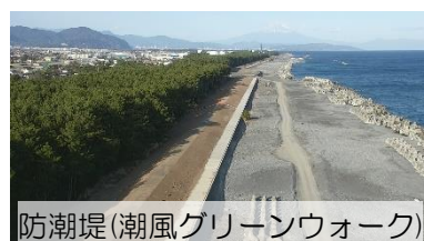
防潮堤(潮風グリーンウォーク)