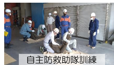
自主防救助隊訓練