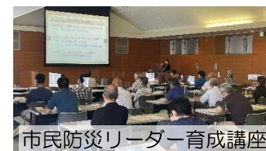
市民防災リーダー育成講座