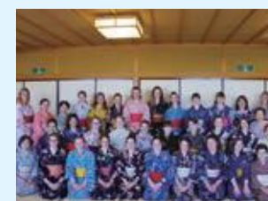
ホバート市女子中高生着物体験

焼津市では、昭和52年にオーストラリアのホバート市と姉妹都市提携を結び、40年以上にわたり交流を続けています。また、東京2020オリンピック・パラリンピックの開催を受け、モンゴルとのスポーツ交流も推進しています。