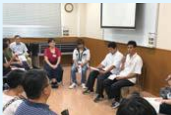
現役学生へのインタビュー

日本語学習の重要性を認識し、将来の目標を明確にするために、外国につながりがある小中学生に向けたガイダンスを開催しています。現役の高校生などが進学のポイントを説明した後、参加者と学生が交流する時間があります。