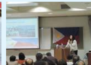
フィリピン文化を学ぼう