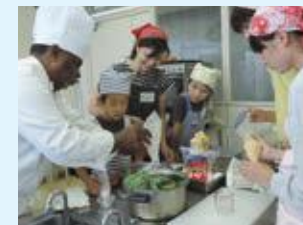
アメリカ南部料理をつくらう

国際感覚を養うために、諸外国の文化を学ぶ国際理解講座を開催しています。焼津市には、様々な国籍の住民が生活しており、母国を紹介していただくために、講座の講師をつとめていただくこともあります。