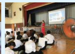
学校でのモンゴル文化講演会