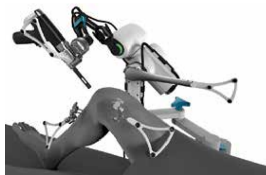
支援ロボットを用いた手術の様子

変形性膝関節症や関節リウマチなどの疾患やけがにより傷んだり、変形した膝関節の表面を取り除い