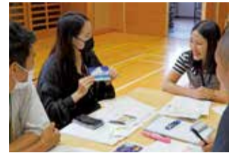
昨年度開催の様子