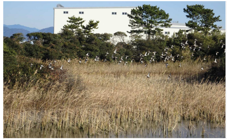
9時台(水鳥の群れが飛び立って行きました)