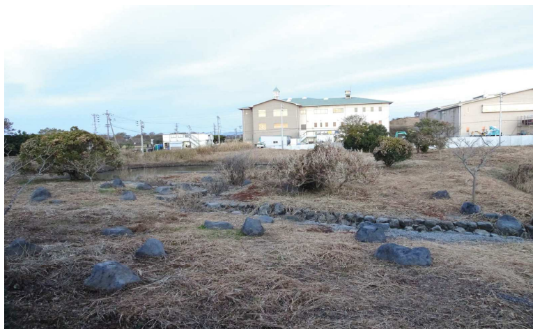
西側池 → 連絡水路