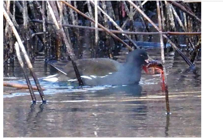
バン(若鳥)・・・ザリガニを捕食