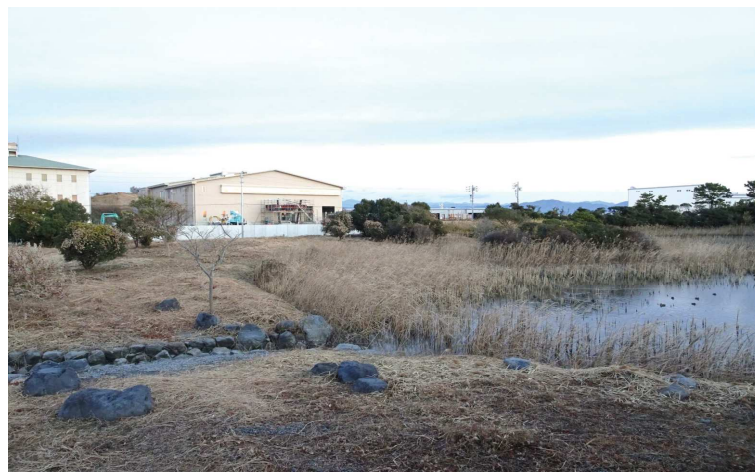
連絡水路 → 東側池