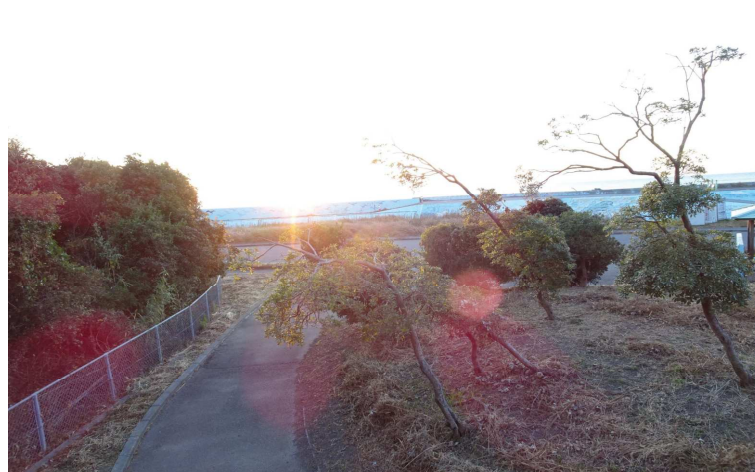
振り返れば、海からの冬の日の出も見れました。