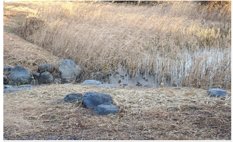
連絡水路 → 東側池