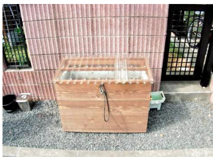
黒土を利用した生ごみ処理容器「キエーロ」

A 申込者数が74人おり、現在配布をしたのが45人で、待機者数が29人いる。また、申し込みが大変好評だったことから、追加制作し、20基再募集を行う。