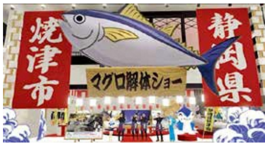
メタバースでふるさと納税をPR！ 世界初バーチャルマグロ解体ショー

力的なお礼品の確保に取り組むほか、若年層向けの媒体でのPRに取り組みしており、先月は20代から30代の若者が多く来場する世界最大のメタバースイベント、バーチャルマーケットに出展をした。