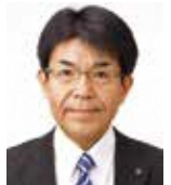
すずきひろみ 鈴木浩己 (公明党議員団)