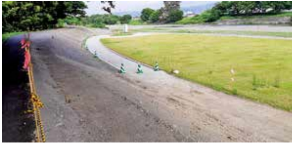
2級河川瀬戸川保福島親水公園 園路・芝生の進捗状況

A 令和6年度以降に市においても遊具などの整備を進めていく予定。今後の計画にあたり、低水護岸の完成が重要となるので、綿密な工事の計画や供用開始の予定時期などの協議を行っており、併せて県事業の整備促進を要望している。