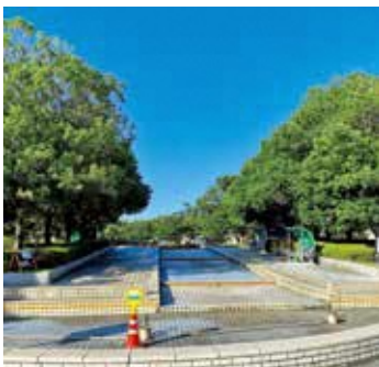
「コロナ感染症防止対策のため噴水休止」と書かれた3年故障中の清見田公園噴水

Q 点検、修繕して、稼働の可否を来年度検討するとのことであるが、修繕の費用と工事の期間は、現在、当初予算編成に向けて必要な経費を精査している。夏場の開園に向け修繕を完了するよう、また、皆さんに喜んで利用していただけるよう考えている。