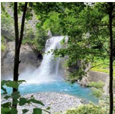
大井川の源流付近

A 地下水量への影響は、河川流量の季節変動や年ごとの変動による影響に比べ極めて小さいと推測されていることが、中間報告の結論であると理解をしている。