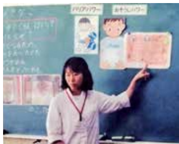
教室での食育の様子 (給食センター会議室掲示)