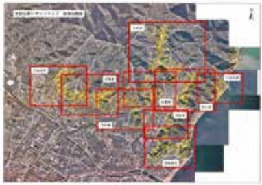
焼津市土砂災害ハザードマップ (全体位置図)

A 国、県や民間における支援制度を活用頂けるよう、意欲ある方への周知、助言に取り組み。実際のニーズも調査し、どういったことができるか考えたい。