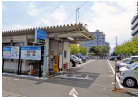
焼津駅北口駐車場

A 令和3年7月から、焼津駅北口駐車場の利用料金に上限制度を導入し、利用件数が増加したため。