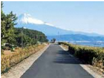
整備が進む潮風グリーンウォーク (焼津市一色)

A 新たな日常への転換や「SDGsの推進」などの観点とカーボンニュートラルの視点を重視して見直しを検討する。