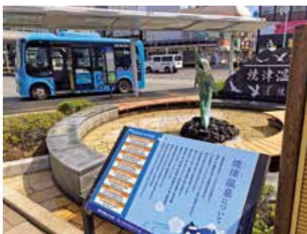
新源泉より1日約700トン湧出する焼津温泉をPRする駅前の足湯施設と市内を走る自主運行バス

A 協議会への支援や連携を図り、その他の地域についても研究し、公共交通の構築に取り組む。