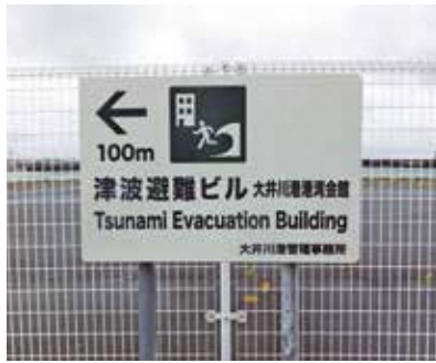
津波・高潮からの非難を促す標示 [大井川港港湾会館付近]

A 小規模な補修を迅速に実施し、道路施設の長寿命化を図る予防保全型の維持管理を進めている。