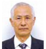
すぎたげんたろう 杉田源太郎 (日本共産党市議会議員)