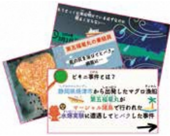
高校生平和大使が作った ビキニ事件の動画絵本

A さらに普及を図るうえでは、実施する農業者に対するメリッとの充実が必要と考えている。