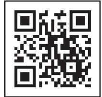
ကိုရိုနာဗိုင်းရပ်စ် ကာကွယ်ဆေး လမ်းညွှန် နှစ်ဖက်မြင်ဘားကုတ်ဒ်

ကိုရိုနာဗိုင်းရပ်စ်ကာကွယ်ဆေး လမ်းညွှန်ဝက်ဘ်ဆိုက်လိပ်စာ: https://v-sys.mhlw.go.jp