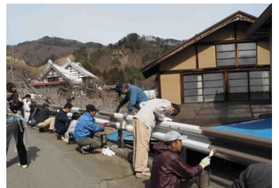
ガードレールの塗り替え