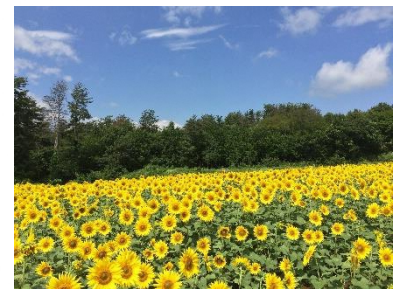
遊休地を活用した花畑