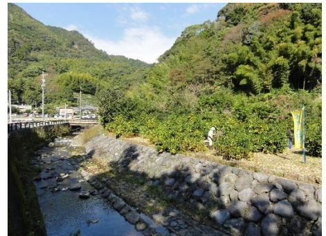
森林に囲まれたみかん畑と花沢川