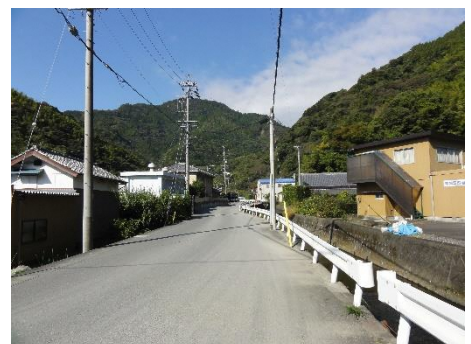
白いガードレールや電線・電柱類